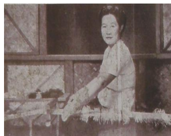
ภาพ 3.4 สมเด็จพระนางเจ้ารำไพพรรณีฯ ทรงทอเสื่อ

นอกจากนี้ ชาวญวนยังเป็นที่รู้จักกันว่า เป็นพวกที่มีฝีมือด้านการทอเสื่อ เสื่อกจันทบูรนั้น ริเริ่มมาจากภูมิปัญญาของชาวญวน ในอดีต ชาวญวนจะทอเสื่อใช้เอง (ดูภาพ 3.4) โดยไปนำต้นกกจากแหล่งอื่นแล้วนำมาสานทอกันในชุมชน ซึ่งสื้อมกกันนั้น ก็หาได้จากชาวจีนในชุมชนเดียวกัน ในรัชสมัยรัชกาลที่ 7 พระนางเจ้ารำไพพรรณี พระราชินีในพระบาทสมเด็จพระปกเกล้าเจ้าอยู่หัวได้เสด็จมาชมการทอเสื่อและจัดตั้งกลุ่มชาวบ้านที่ทอเสื่อเพื่อไปสอนการทอเสื่อแก่เหล่าข้าราชการที่วังสวนบ้านแก้ว จังหวัดจันทบุรีด้วย ภูมิปัญญาเรื่องการทอเสื่อนั้น ปัจจุบันแม้จะเลือนหายไปจากชาวญวน หรือการเคลื่อนย้ายวัฒนธรรมการทอเสื่อ ไปอยู่ที่ตำบลบางสระเกล้าแทนชุมชนชาวญวนแล้วก็ตาม อีกทั้งในเวลาต่อมา อุตสาหกรรมพลอยได้เกิดขึ้นและแพร่หลาย ชาวญวนจึงพากันหันไปทำพลอยแทนการทอเสื่อดังที่ปรากฏเป็นชุมชนค้าพลอยตรอกกระจ่างบริเวณตลาดบน แหล่งค้าขายอัญมณีที่ใหญ่ที่สุดของจังหวัดจันทบุรีปัจจุบัน (สง่า นามทอง, สัมภาษณ์เมื่อวันที่ 17 กรกฎาคม 2553) การทอเสื่อ ปัจจุบันมีการฟื้นฟูโดยกลุ่มซิสเตอร์และครูโรงเรียนสตรีมารดาพิทักษ์ ในช่วงโมงงานฝีมือเพื่อให้เด็กๆ ในชุมชนรุ่นหลัง ได้รู้จักภูมิปัญญาการทอเสื่อจันทบูร และผลิตภัณฑ์ของเหล่านักเรียน จะนำไปวางจำหน่ายในงานประจำปีต่างๆ ของชุมชนหรือร้านขายของที่ระลึกชุมชน เป็นต้น