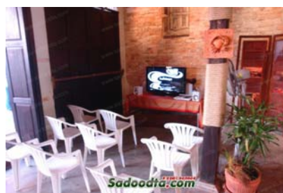
ภาพ 4.6 ห้องประชุมภายในพิพิธภัณฑบ้านเลขที่69

ทั้งนี้ ในกระบวนการจัดการชุมชนริมน้ำจันทบูรนั้นก็พบปัญหาและอุปสรรคอยู่เช่นกัน นั่นคือ ปัญหาเรื่องการขาดความเข้าใจของคนในชุมชนบางส่วน เกี่ยวกับแนวทางการทำงานของแกนนำ นอกจากนี้ แผนพัฒนาเส้นทางสายเศรษฐกิจวัฒนธรรม ทำให้มีคนภายนอกสนใจมาจับจองเช่าพื้นที่ค้าขาย เพราะขาดความเข้าใจในความต้องการและทิศทางของชุมชนฯอย่างถ่องแท้ และกฎหมายเทศบัญญัติที่อาจไม่เอื้อต่อการอนุรักษ์สถาปัตยกรรมบางประการ แต่ปัญหาเหล่านี้แกนนำ มีวิธีแก้ไขโดยการจัดกิจกรรมภายในชุมชนต่างๆเพื่อเรียกคนในชุมชนให้มาเข้าร่วม จะได้นำไปสู่กระบวนการเรียนรู้ร่วมกัน สร้างความเข้าใจที่ตรงกัน (ดูภาพ4.6) ตลอดจนการขอความร่วมมือจากหน่วยงานต่างๆรวมทั้งการตั้งรับกระแสปัญหาที่กำลังจะเข้ามาในอนาคตอย่างระมัดระวัง ทั้งหมดนี้ คือบทบาทของแกนนำในกระบวนการพัฒนาชุมชนริมน้ำจันทบูรที่สะท้อนความเข้มแข็งและความมีชีวิตชีวาที่ดีและน่าสนใจ ในการขับเคลื่อนชุมชนแห่งวิถีวัฒนธรรมนี้ให้เป็นชุมชนที่เข้มแข็งและดำรงอยู่ท่ามกลางกระแสการเปลี่ยนแปลงในอนาคต (ประภาพรรณ นัตรมาลัย, สัมภาษณ์เมื่อวันที่ 2 มกราคม 2554)