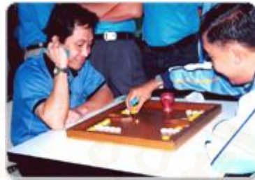
ภาพ 3.5 สกา

ชาวญวน ปัจจุบันก็ยังมีการเล่นการแข่งกันอยู่โดยเฉพาะในช่วงที่ชุมชนริมแม่น้ำจันทบูรจัดงานชาวญวนฝั่งวัดโรมันแคทอลิกก็จะแสดงการละเล่นลูกกรันเพื่อให้คนรุ่นหลังและผู้มาเยือนได้เห็น