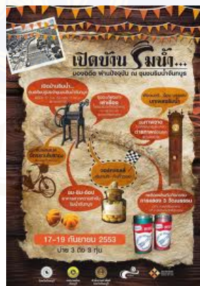
ภาพ 4.5 แผ่นประชาสัมพันธ์งานชุมชนริมน้ำ

จากตัวอย่างเรื่องกลุ่มเป้าหมาย จะพิจารณาได้ว่า ชุมชนริมน้ำจันทบุรีนั้น ไม่ได้ปฏิเสธการท่องเที่ยว อีกทั้งยังยินดีที่จะให้ผู้คนจากที่อื่นๆ ได้มีโอกาสเข้ามาสัมผัสชุมชนริมน้ำจันทบุรีในเชิงของการอนุรักษ์ ซึ่งก็สอดคล้องกับแนวทางของกลุ่มแกนนำที่กล่าวไว้ตลอดเวลาคือ ชุมชนริมน้ำจันทบุรีไม่ใช่แหล่งท่องเที่ยวที่จะพัฒนาไปเป็นตลาดค้าขาย หากแต่เป็นแหล่งท่องเที่ยวเชิงวิถีชีวิตและวัฒนธรรมที่ผู้คนที่ประสงค์จะเข้ามาต้องเข้ามาเพื่อซึมซับรูปแบบที่เป็นอยู่ของชุมชนมากกว่าการเข้ามาเพื่อหวังจะเห็นภาพตลาดสินค้า (ดูภาพ 4.5)