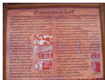
ภาพ 3.2 ป้ายนิทรรศการเจ้าของบ้าน

ชุมชนริมน้ำจันทบูรปัจจุบัน ผู้มาเยือนจะพบว่า บริเวณหน้าบ้าน โดยเฉพาะบ้านเก่าแก่ เกือบทุกหลังจะจัดทำป้ายนิทรรศการบอกประวัติความเป็นมาของเจ้าของบ้าน เพื่อเป็นการนำเสนอ เรื่องราว และตัวตนของบ้านเรือนแต่ละหลังที่อยู่คู่ชุมชนริมน้ำจันทบูรมายาวนาน ตกทอดสู่รุ่นลูก รุ่นหลาน อีกทั้งยังเป็นความรู้แก่ผู้มาเยี่ยมชมในด้านประวัติศาสตร์อีกด้วย ตัวอย่างเช่น บ้านของ อดีตข้าราชการเก่าแก่ อย่างบ้านหลวงราชไมตรี (ดูภาพ 3.2) ซึ่งข้อมูลที่เขียนไว้บนป้ายนิทรรศการก็ จะเป็นประวัติของท่านตลอดจนคุณงามความดีที่ท่านได้ทำต่อชุมชนและประเทศชาติ ซึ่งป้าย นิทรรศการบ้านเล่าเรื่องเหล่านี้ คือความภูมิใจของคนรุ่นหลังผู้อยู่อาศัยในบ้านที่มีความเป็นมาและมี บทบาทในยุคสมัยหนึ่งส่งผ่านมาสู่ปัจจุบันสมัยนั่นเอง