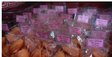
ภาพ 4.4 ขนมไข่ป่าไต้

จากการสัมภาษณ์คุณชายไต้ 7 ซึ่งคุณชายขายขนมไข่มานานแล้วกว่าสิบปี นอกจากนี้คุณชายยังอาศัยอยู่ในชุมชนแห่งนี้มาตั้งแต่เด็ก และรู้จักกับบ้านเรือนโบราณหลายหลัง พบเห็นความเปลี่ยนแปลงของชุมชนริมน้ำจันทบูรมานาน คุณชายให้ความเห็นว่า รู้สึกดีใจ ที่ชุมชนริมน้ำจันทบูรยังคงความเป็นชุมชนที่สงบ มีวิถีชีวิตที่เปลี่ยนแปลงไม่มาก ไม่กลายเป็นตลาดหรือเมืองการค้าที่พลุกพล่าน ขนมไข่ของคุณชายเป็นที่รู้จักก็เพราะทำขายมานาน (ดูภาพ 4.4) ผู้คนที่แวะเวียนเข้ามาเพื่อซื้อขนมไข่คุณชายก็มีอยู่เรื่อยๆ และหลายคนก็ซื้อขนมคุณชายมาตั้งแต่วัยรุ่นยันจนถึงรุ่นลูก จากการทำชุมชนริมน้ำกลายเป็นแหล่งท่องเที่ยวคุณชายก็เห็นว่าเป็นการดีที่ชุมชนริมน้ำจันทบูรจะเป็นแหล่งท่องเที่ยวเชิงวัฒนธรรม เพราะผู้คนที่เข้ามาเยี่ยมชมจะได้สัมผัสกับวิถีชีวิตที่สงบ สวยงามและความเป็นกันเอง รวมทั้งยังทำให้คนที่ค้าขายอยู่แต่เดิมอย่างคุณชายก็พลอยขายขนมไข่ได้ ทำให้ขนมของคุณชายเป็นที่รู้จักมากขึ้น และก็เป็นจริงดังที่คุณชายกล่าว ปัจจุบัน ขนมไข่คุณชายไต้ กลายเป็นของกินขึ้นชื่อประจำชุมชนริมน้ำจันทบูรไปแล้ว ผู้ที่แวะเวียนเข้ามา ต่างก็ต้องมาชิมและซื้อติดไม้ติดมือไปเป็นของฝากกันทุกคน(คุณชายไต้, สัมภาษณ์เมื่อวันที่ 8 มิถุนายน 2554)