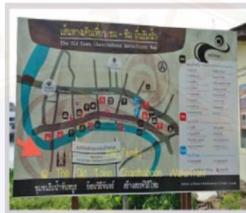
ภาพ 4.2 เส้นทางสายเศรษฐกิจวัฒนธรรม

เข้าไว้ด้วยกัน โดยพื้นที่ชุมชนริมน้ำจันทบูรทั้งหมดจะรวมเข้าเป็นเส้นทางสายเศรษฐกิจและวัฒนธรรม (ดูภาพ 4.2) เพื่อกระตุ้นนักท่องเที่ยวให้เข้ามาบริโภคสินค้าอัญมณีและรวมไปถึงสินค้าทางวัฒนธรรมและวิถีชีวิตของชุมชนริมน้ำจันทบูรด้วยในคราวเดียวกัน ทั้งนี้ เพื่อเป็นการกระตุ้นเศรษฐกิจการค้าพลอยในตลาดพลอยเมืองจันทน์และกระบวนการท่องเที่ยวเชิงวัฒนธรรม เป็นการสร้างรายได้สู่จังหวัดและชุมชน (เกษม สุขแสวง, สัมภาษณ์เมื่อวันที่ 8 มิถุนายน 2554 1 )