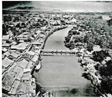
ภาพ 4.1 ชุมชนริมน้ำจันทบูรในอดีตสมัยรัชกาลที่ 5

ปัจจัยเหล่านี้ คือ ที่มาของการริเริ่มโครงการที่ทางจังหวัดเล็งเป้าหมายไปที่ชุมชนริมน้ำจันทบูร โดยในบทนี้จะได้กล่าวถึงการเข้ามาและบทบาทของพานิชจังหวัดต่อชุมชนริมน้ำจันทบูร รวมทั้งปฏิกิริยาของชุมชน การเกิดขึ้นของกลุ่มแกนนำชุมชนและความคิดเห็นตลอดจนกระบวนการรับทราบนโยบายของพานิชจังหวัดของชุมชน อีกทั้ง การจัดการชุมชนในมิติทางทรัพยากรวัฒนธรรมซึ่งก็คือ ทุนทางสังคมวัฒนธรรมของชุมชนริมน้ำจันทบูรดังกล่าวด้วย