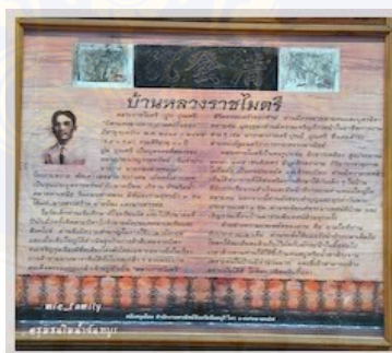
ภาพ 4.7 ประวัติบ้านหลวงราชไมตรี

จากการศึกษาพบว่า ในท่ามกลางกระบวนการทำงานของชุมชนฯแบบผสมผสานนั้น กลุ่มคนสูงวัยส่วนใหญ่ ตั้งแต่ชุมชนริมน้ำจันทบูรมีการจัดการดำเนินการด้านต่างๆภายในชุมชน ดังที่กล่าวมา กิจกรรมต่างๆตลอดจนการเข้ามาของนักท่องเที่ยวที่มีความสนใจเข้ามาสัมผัสเยี่ยมชม วิถีวัฒนธรรมของชุมชนริมน้ำจันทบูร ทำให้เกิดการเปลี่ยนแปลงในด้านพฤติกรรมบางอย่างของกลุ่มผู้สูงวัย นั่นคือ แต่เดิม ก่อนเกิดกระบวนการต่างๆเหล่านี้ กลุ่มคนสูงวัยมักเก็บตัวอยู่ในบ้าน แต่เมื่อชุมชนฯมีการจัดการเพื่อการท่องเที่ยว มีการจัดกิจกรรมชุมชนและเกิดการเปลี่ยนแปลงขึ้น ผู้สูงอายุมักจะเริ่มออกมาเดินชมความเปลี่ยนแปลงเหล่านี้ ตลอดจนออกมามีส่วนร่วมกับกิจกรรม ชุมชนร่วมกับกลุ่มคนวัยต่างๆ อีกทั้งยินดีเอื้อเฟื้อข้อมูลส่วนตัวเกี่ยวกับบ้านที่อยู่อาศัยโบราณแก่ กลุ่มแกนนำชุมชน จัดทำแผ่นป้ายนิทรรศการบอกเล่าประวัติความเป็นมาของเจ้าของบ้าน (ดูภาพ 4.7) หลายคน มีเอกสาร หลักฐานด้านประวัติศาสตร์ที่เกี่ยวข้อง ต่างก็เต็มใจนำมาเพื่อใช้ใน กระบวนการจัดการชุมชนในมิติประวัติศาสตร์ นอกจากนี้ ผู้สูงอายุมักกล้าที่จะพูดคุย ทักทาย นักท่องเที่ยวที่เข้ามามากขึ้น แสดงถึงความเป็นกันเอง ซึ่งก่อเกิดมาจากความรู้สึกรักและภูมิใจใน ชุมชนฯของตนเอง และยินดีที่จะนำเสนอสู่ผู้คนภายนอก