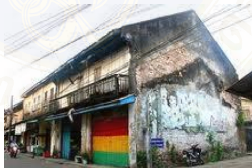
ภาพ 3.3 ตัวอย่างบ้านที่ลงโฆษณา

นอกจากนี้ ในชุมชนริมน้ำจันทบูร มีตึกกรมบ้านเรือนอยู่หลายหลัง ที่เป็นสถาปัตยกรรมแบบโคโลเนียลสไตล์ (colonial style) ประกอบกับเรือนแถวไม้ฉลุสวยงามจากการที่ฝรั่งเศสยึดเมืองจันทบูรเป็นตัวประกัน ถึง 11 ปี ทำให้สถาปัตยกรรมในชุมชนที่ตั้งอยู่ริมน้ำนั้นได้รับเอาอิทธิพลของชาวตะวันตก จนทำให้ชุมชนแห่งนี้มีอาคารบ้านเรือนแบบผสมผสานศิลปกรรมนั้น ทำให้มีความหลากหลายน่าสนใจ สำหรับอาคารเก่าอายุกว่าร้อยปีที่น่าสนใจนั้นมีหลายหลังเช่น บ้านหลวงประกอบนิติสาร บ้านขุนบูรพาภิผล บ้านหลวงราชไมตรี เป็นต้น ซึ่งมีทั้งอาคารแบบจีนแบบตะวันตก อาคารแบบปั้นงและสิงคโปร์ บ้านไม้หลังคาปั้นหยา บ้านไม้ริมน้ำ เรือนประดับลายไม้ขนมปังขิง (พลาดิษฐ์ สิทธิชัยกิจ, 2554) ทำให้ย่านนี้กลายเป็นสถานที่ที่รู้จักกันในวงการภาพยนตร์และสื่อโฆษณาว่า สามารถปรับเป็นฉากเมืองเก่าได้อย่างเหมาะสม อีกทั้งพบเห็นสถาปัตยกรรมของชุมชนริมน้ำจันทบูรปรากฏอยู่ตามสื่อต่างๆ และเป็นที่ยึดใจมากยิ่งขึ้น สำหรับนักท่องเที่ยวที่เข้ามาตามรอยภาพยนตร์และโฆษณาเหล่านั้น บ้านเรือนหลายหลังในชุมชนริมน้ำจันทบูรที่เคยถูกนำเสนอผ่านสื่อ ต่างก็มีการบอกกล่าวแก่ผู้คนและนักท่องเที่ยวจากต่างถิ่นผ่านการติดป้าย ตีครุฑที่เป็นการยืนยันว่า บ้านเรือนของพวกเขา และย่านนี้ เคยได้รับความสนใจจากวงการสื่อต่างๆ และเคยปรากฏออกทางสื่อโทรทัศน์ นิตยสารต่างๆ รวมทั้งเว็บไซต์ที่มีชื่อเสียงมาแล้ว (ดูภาพ 3.3)