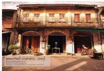
ภาพ 3.1 สถาปัตยกรรมแบบโคโลเนียลสไตล์

และเป็นบ้านแบบโบราณซึ่งเป็นสถาปัตยกรรมแบบโคโลเนียลสไตล์ (ดูภาพ 3.1) ที่สำคัญ บ้านเลขที่ 69 มีความทรุดโทรมอย่างมาก หากปล่อยทิ้งไว้อาจเสียหายและน่าเสียดาย เนื่องจากเจ้าของบ้านเลขที่ 69 ปัจจุบันคือ คุณบุญพริ้ม ปฎิรูปานุสรณ์ ทายาทขุนอนุสรณ์สมบัตินั้นอาศัยอยู่กรุงเทพฯ และอายุมาก จึงไม่ค่อยได้แวะเวียนมาหรือเข้ามาอยู่อาศัยยังบ้านเลขที่ 69 นี้ มีเพียงผู้มาเช่าอยู่ ซึ่งก็สามารถดูแลบ้านเลขที่ 69 ได้ไม่ทั่วถึง