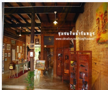
ภาพ 4.3 สภาพภูมิทัศน์ภายในพิพิธภัณฑสถานเลขที่ 69

นอกจากนี้ จากการพูดคุยกับ พี่น้ำ หนึ่งในนักศึกษาปริญญาโท สถาบันอาศรมศิลป์ ผู้เข้าไปอาศัยในชุมชนริมน้ำจันทบูรเพื่อทำวิทยานิพนธ์ด้านภูมิสถาปัตยกรรมศาสตร์ กล่าวว่า “ การเข้ามาของนักศึกษาอาศรมศิลป์เป็นไปอย่างสะดวกและได้รับความร่วมมือจากทั้งกลุ่มแกนนำและชาวบ้านเป็นอย่างดี ชาวริมน้ำจันทบูรมีความเป็นกันเอง ตนนั้นได้มีโอกาสเข้าร่วมประชุมกับชาวบ้านและกลุ่มแกนนำแทบทุกครั้ง และทำให้ได้ทราบข้อมูลตลอดจนความเป็นไปในชุมชนรวมถึงนโยบายจากทางจังหวัดเป็นระยะ” และจากการพูดคุยกับ อ้อ นักศึกษาอีกคนหนึ่งได้กล่าวว่า “ อ้อได้เข้าไปช่วยชาวบ้านและแกนนำในขั้นตอนการปรับปรุงสภาพภูมิทัศน์ชุมชน ที่เห็นได้ชัดคือ พิพิธภัณฑสถานเลขที่ 69 (ดูภาพ4.3)การจัดวาง ทั้งการทำสีและการออกแบบตกแต่งภายใน ทั้งอ้อและพี่น้ำได้เป็นผู้ออกไอเดีย และอาจารย์ประภาพรณก็จะนำความเห็นของทั้งสองไปถามแกนนำคนอื่นๆ รวมถึงคนอื่นๆที่เข้ามาช่วยในการปรับปรุงพิพิธภัณฑสถานด้วย”