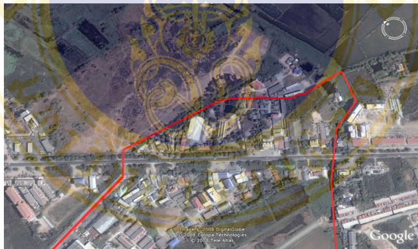
ภาพ 2 แผนที่ตำบลบางกระสั้น

พื้นที่ศึกษา : เทศบาลตำบลบางกระสั้น อำเภอบางปะอิน จังหวัดพระนครศรีอยุธยา ลักษณะที่ตั้ง / อาณาเขตและเขตการปกครอง